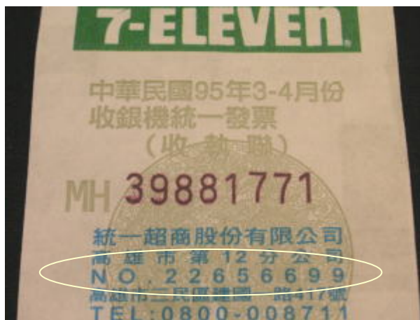
統一發票(公給領收書)の領收印