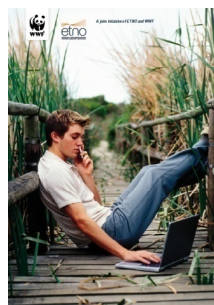
SAVING THE CLIMATE @ THE SPEED OF LIGHT

2020年をターゲットとした戦略を2010年までに策定。戦略では、さらなるICTサービスやシステムソリューションを盛り込み、持続可能な消費、生産、都市計画、コミュニティ開発等の領域にも踏み込んだ、意欲的なCO 2 排出削減のICT利用をターゲットとする。