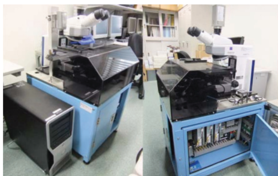
図2 多項目検査対応バーチャルスライドプロトタイプ

のように一定の厚さとなっておらず、数ミクロンから数十ミクロンと標本厚が変化するため、フォーカス合成技術などを用いたシステム対応が必要となる。そのため、血液診断や細胞診断を対象とした場合における自動化技術について研究し、次世代バーチャルスライドシステムを開発した。研究成果であるプロトタイプハードウェア装置を図2に示す。耐振動性能については駆体と顕微鏡本体を一体化させることにより対物 100 倍レンズを用いた場合においても振動吸収性能は臨床現場における利用にも十分なパフォーマンスを示した。またハードウェア制御を行う際の並列パイプライン処理による高速撮影制御技術により記録媒体への遅延のない撮影が可能となりカメラフレームレート最大値による Z 軸方向撮影を実現した。これにより撮影成功率において 90%以上、撮影所要時間 30 分以内をクリアし、臨床実用化条件を達成した。