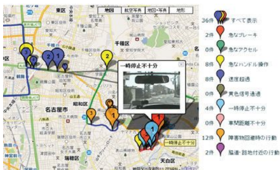
図 2 : Web ブラウザを用いた運転教示システム

上記の危険状況識別器に基づき、次世代ドライブレコーダのプロトタイプを実装し、その有効性を検証するため 33 名のドライバに対して実証実験を行った。実験では、検出した危険状況を Web ブラウザを用いてドライバにフィードバックする安全運転教示システムを構築し、運転の安全性の改善効果を確認した。教示システムでは、その日の危険検出箇所を地図上に示し(図 2)、検出された危険状況の映像やセンサ信号のグラフと共に、検出された理由や改善方法を示す教示文をドライバに提示する。実証実験の結果を図 3 に示す。教示を受けなかったドライバは危険検出数が減少しないのに対し、教示を受けたドライバは、危険事象が約半減し、提案システムの有効性が確認された。