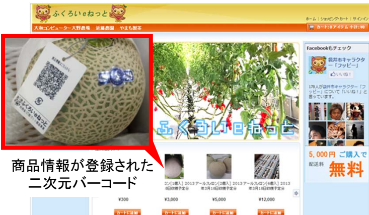
ECサイト「ふくろいeねっと」のポータル画面

その際、生産者が地域産品に付けられたタグの二次元バーコードに商品情報(生産者や農薬の使用履歴等)を予め登録しておくことで、消費者はインターネットを通じてこれらの情報を閲覧することができ、生産者の見える化による食の安全を実現しています。