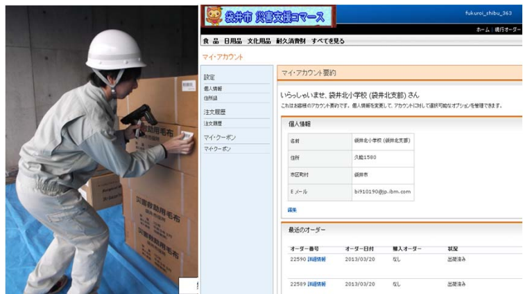
支援物資集積所における登録作業の図(左)と災害時支援物資供給システムの操作画面(右)

従来までは、システムによる管理を行っていなかったため、リアルタイムの情報把握ができないなどの課題がありました。この仕組みにより、これらも解決することができました。