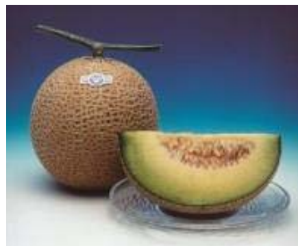
特産品のクラウンメロン

平成22年には「袋井市農業振興ビジョン」を策定し、「担い手の確保」「販売の強化」「市民との協働」をキーワードとして、「農地の適正利用」「地産地消と食育の推進」「地域環境保全活動の推進」等、さまざまな施策を展開しています。