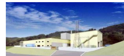
森林資源の有効活用 木質バイオマス発電等への 燃料安定供給