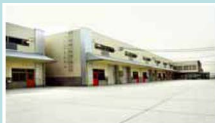
宇治ベンチャー企業育成工場