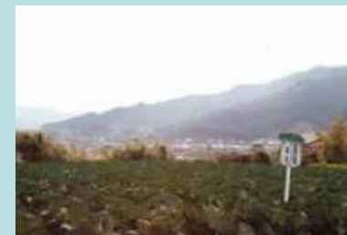
地産地消の給食畑