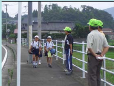
地区コミュニティ協議会による防犯活動