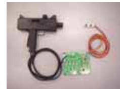
シューティングゲーム用 コントローラなどに使用 する「光学式2次元座標検 出システム」