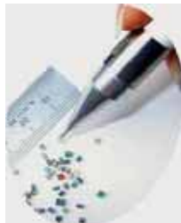
ハイテクペンセット HPシリーズ