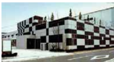
産業振興センター

光IC 開発、マルチメディア機器対応システム開発、インダストリアル・エレクトロニクス開発、ハイテク機器製造・開発、環境改善機能性塗料の研究開発、真空成膜装置の製造、常圧プラズマ技術による滅菌・殺菌洗浄装置の開発など