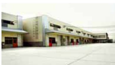
宇治ベンチャー企業育成工場