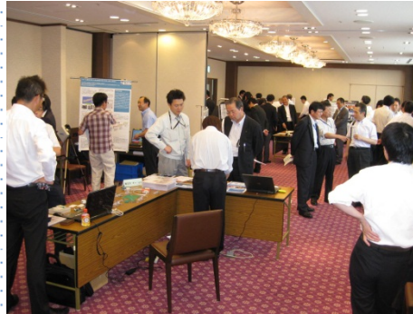
来場者からの熱心な質問に対応する出展社