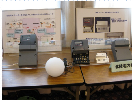
スマートメーター