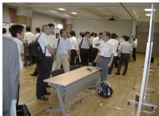
【ポスターセッションの様様】