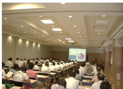
【5課題の先生方のプレゼンテーション】