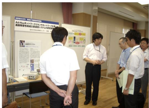
【ポスターセッションの様様】