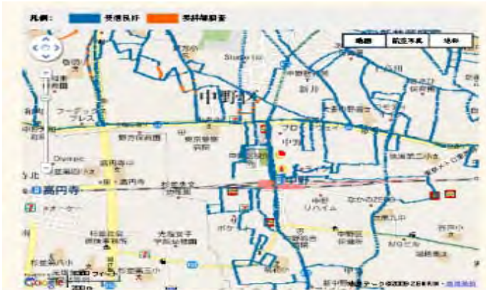
← デジサポホームページでのウェブ公表

地デジ受信の目安をインターネットで公表して、受信障害が解消が見込まれる地域を開示し、地デジ完全移行に伴い共聴施設を廃止する地域での当事者間協議や個別受信移行を促進。