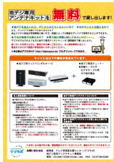
簡易アンテナセット一式を無料貸し出し