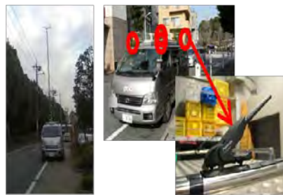
<個別詳細調査> <簡易連続調査(ぱぱっと調査)>