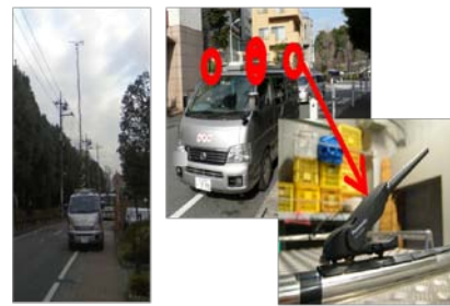
<個別詳細調査> <簡易連続調査(ぱぱっと調査)>