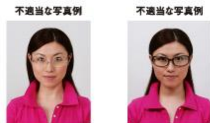
眼鏡のフレームが目にかかっているもの フレームが非常に太く目や顔を覆う面積が多いもの

眼鏡のフレームが目にかかっているものやフレームが非常に太いものなどは不適当です。