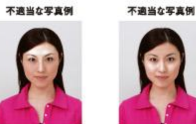
額に過度のテカリがあるもの 頬などに過度のテカリがあるもの

額、頬などに過度のテカリがあるものについては、免許証の写真が変色する場合がありますため不適当です。