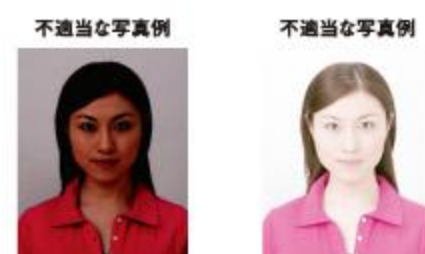
露出不足（露出アンダー） 露出過多（露出オーバー）

サングラスやヘアバンド以外にも、顔の器官が隠れるような帽子や衣服、布などの大きめの装飾品等は不適当です。