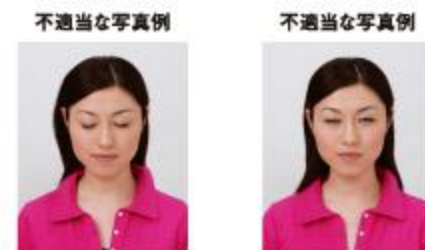
目をつぶっているもの 目をはっきりと開けていないもの

撮影時にピントが合っていないかたり、手ぶれしてしまったために画像が不鮮明なものは不適当です。