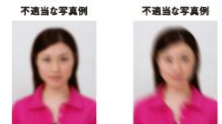
ピンぼけにより不鮮明なもの 手ぶれにより不鮮明なもの

撮影時にピントが合っていないかたり、手ぶれしてしまったために画像が不鮮明なものは不適当です。