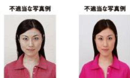
ノイズがあるもの 画像処理を施したもの

画像ファイルの過剰な圧縮等が原因となってノイズ（画像の乱れ）が発生しているもの、変形やマスキング（縁取り）などの画像処理を施したものは不適当です。