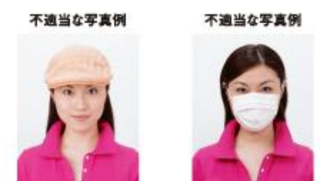
帽子によって頭部が隠れているもの マスクで顔の下半分が隠れているもの

サングラスやヘアバンド以外にも、顔の器官が隠れるような帽子や衣服、布などの大きめの装飾品等は不適当です。