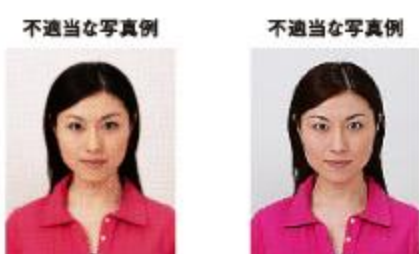
ドットやインクのにじみなどがあるもの ジャギーがあるもの

デジタル印刷の場合、ドット（網状の点）やジャギー（階段状のギザギザ模様）、インクのにじみなどがみられるものは不適当です。