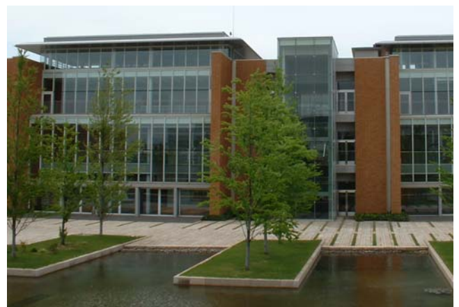
Current College Building (Tachikawa) 現立川校舎