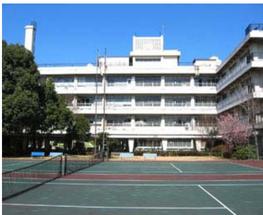
Former College Building (Azabu) 旧麻布校舎