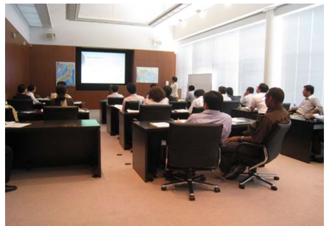
Training course in Local Governance 2010 at International Seminar Room 2010 年地方自治研修 (国際研修室)