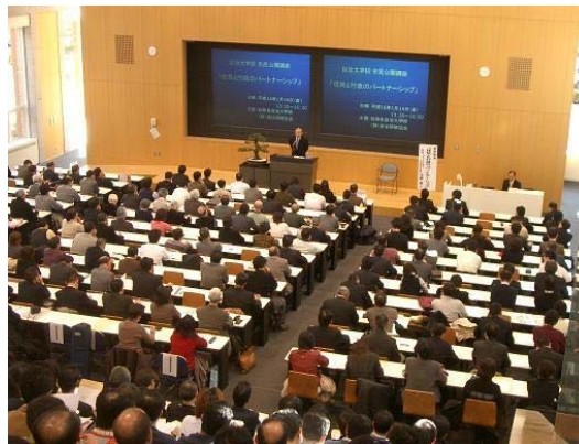
Lecture at a large lecture room 大教室での授業風景

The general training course deals with key political issues faced by local public entities to provide systematic and intensive training on environment and welfare policies.