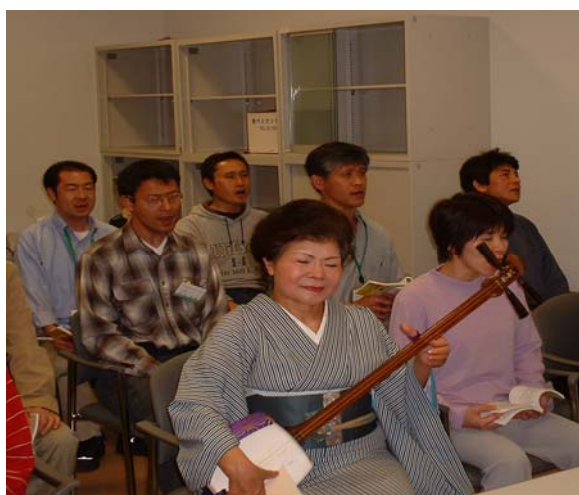
Club activity Folk song 民謡

自治大学校卒業生の会である「校友会」は、研修生が当校で築いた親睦関係をつなぐネットワークとして機能しています。このネットワークを通じて、同窓生は全国のそれぞれの職場から一体感を高めていきます。