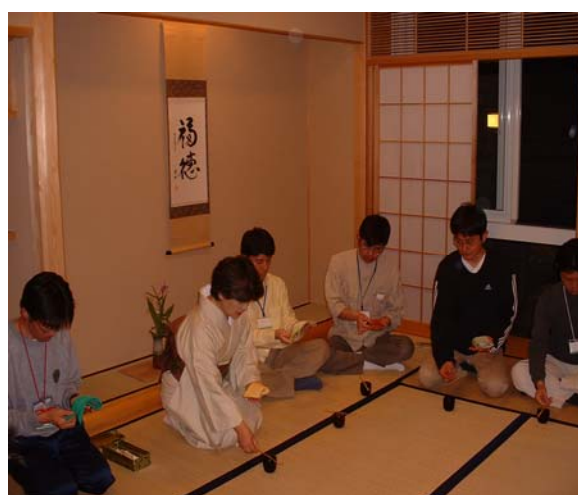
Club activity Tea party 茶道