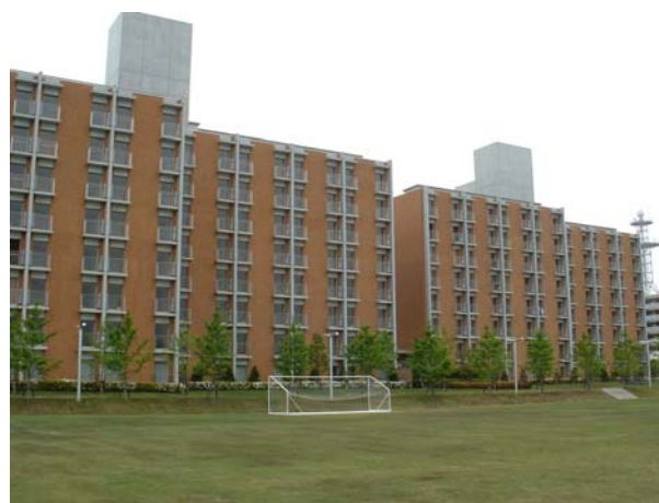
Trainee Residence "Reitakuryo" and "Senshinryo" 寄宿舎「麗澤寮」と「洗心寮」

また、全国の地方公共団体から派遣された研修生が、全寮制による合宿研修に参加し、活発な交流を行うことによって、特定の地域や行政分野の枠を越えた幅広い知識や視野を得ることができます。