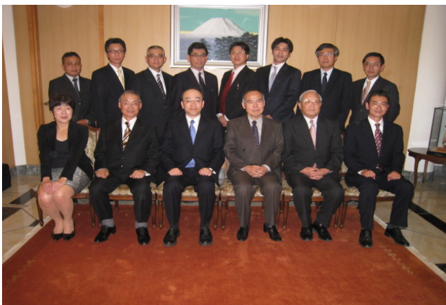
EROPA Executive Council Meeting in Nepal, 2010 2010 年 EROPA 執行政事会 (ネパール)

また、EROPA の要請に基づき、JICA (国際協力機構) と共同で、自治大学校では、発展途上国の地方行政関係公務員の研修 (期間 6 週間) を実施しています。昭和 39 年に初めて研修を実施して以来、毎年度 10 名前後の外国人研修生を対象にして研修が行われています。