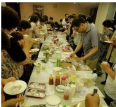
商品開発講座の実施

前職であるデパート食品バイヤーというキャリアを生かして「売り場が求めている商品開発」を特性に、各市町村が持つ地域素材を活用した商品化を行っています。