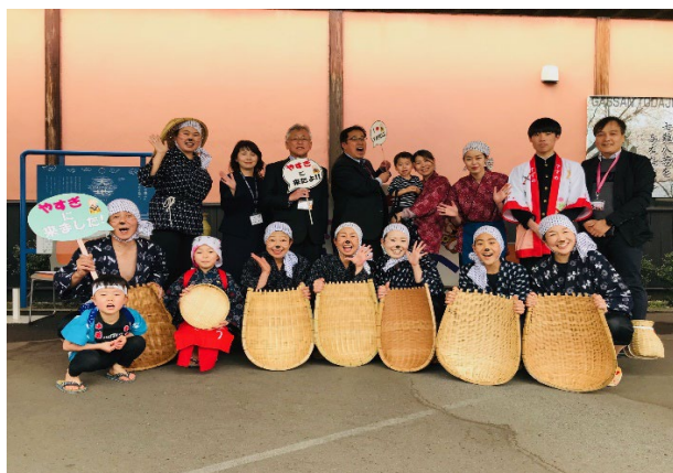
どじょう掬いで迎え隊

島根県・玉造温泉にある観光施設で長年勤務する間、首都圏からみた観光・島根の知名度に低さを痛感。都市部と島根の観光地仲人役『島根県観光誘客プロモーター』に就任（島根県トップブランド事業2004年10月～2008年3月）。和菓子屋巡りなど地元ならではの工夫を凝らした独自の観光プランを立案し旅行会社、マスコミ、企業に提案、誘客活動をに注ぐ。朝ドラ『だんだん』島根ロケコーディネーターとして島県内広域でのロケに携わる。『ゲゲゲの女房』『わろてんか』と朝ドラに3本、現地のコーディネートを行う。隠岐空港誘客プロモーター、萩・石見空港誘客プロモーター、安来市観光プロモーター、奥出雲町観光プロモーターと県内の観光誘客に関わる。国内クルーズ船のエンターテインメント、現地ツアー造成にも関わる。縁もゆかりもない秋田県横手市のシティプロモーションアドバイザー（H14～H18）として100日間通い観光資源発掘、プロモーションに関わる。