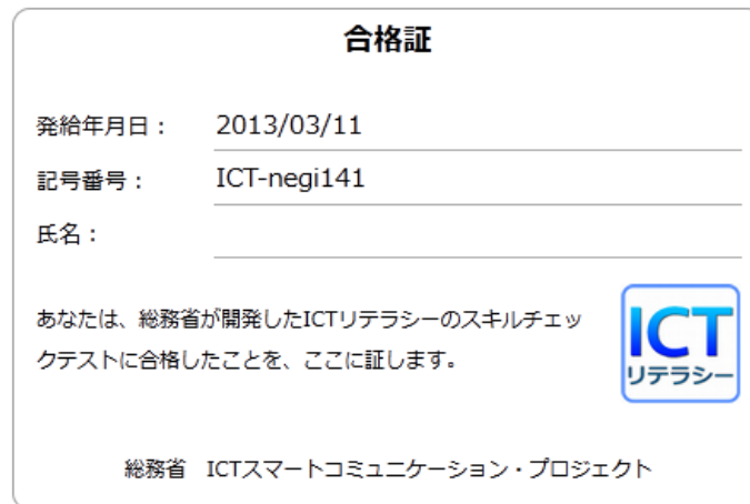
図表 7 合格証