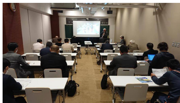
福井県若狭町の若手職員研修