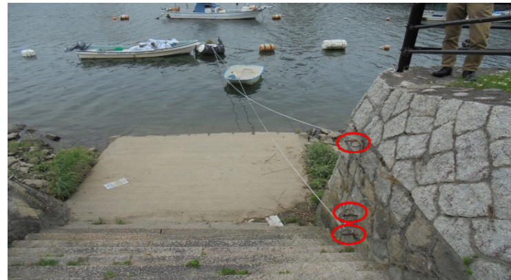
係留ロープ固定のために護岸に打設された鉄製杭【旧太田川】