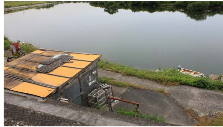
占用許可なく小屋が設置【高梁川】