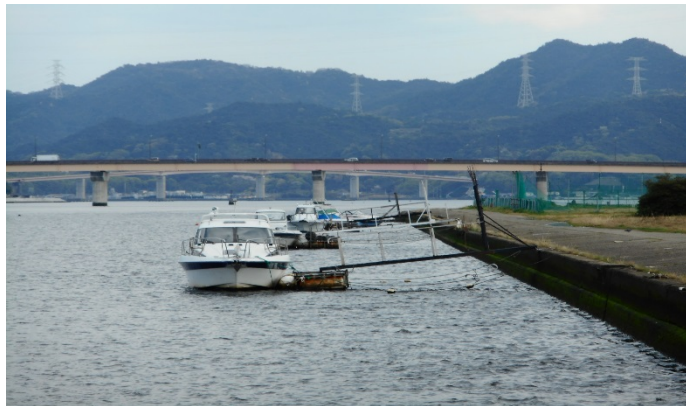
不法係留船(プレジャーボート)の係留(栈橋も設置)【旭川】