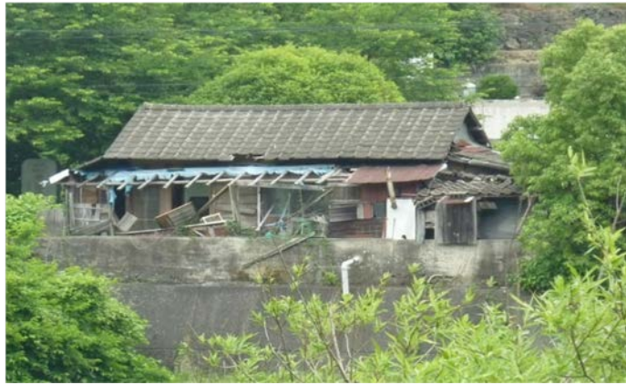
国が管理する以前に設置された家屋【小瀬川】