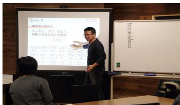
<地域の中学生を中心とした学習塾>

しかしながら事業、移住者の定住促進の全てがうまくいったわけではなく、移住者が短期間で都市部に戻ってしまったり、事業を推進する人物が道半ばで辞めてしまったりするなど、人間関係の問題も発生し、一筋縄にはいかなかった。