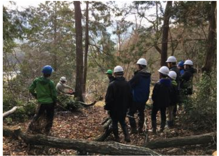
<中高生対象まちゼミ>

朝来市内の面白い大人を、国語の現代文風に紹介し、さらにイメージを膨らませるためにyoutube動画を作成。生徒たちは事前に、動画を見ながら現代文を読解し、読解力をつけつつ、地域の理解を深めていく。