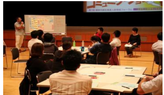
<人財育成フォーラム>

文部科学省官僚と現役の高校教員を招き、国の目指している人材育成の方向性や、教育現場での創意工夫を市民と共有した。さらにワークショップを通して、市民一人ひとりが人材育成の主役として歩み出せるよう促した。 http://www.city.asago.hyogo.jp/cp/0000007049.html