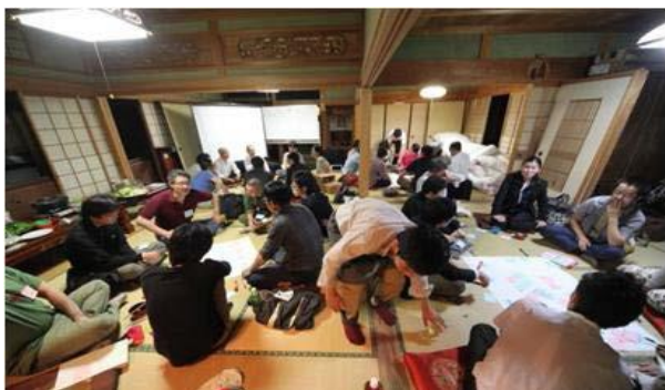
<地元の人との交流イベント>