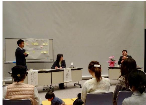
＜ファミリー子育て教室＞