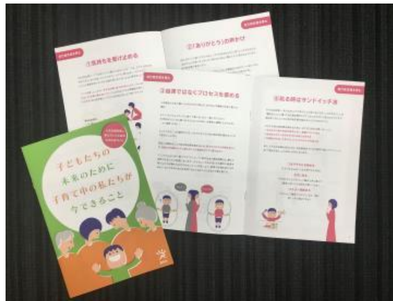
<自己肯定感を育む子育て応援パンフレット>

文部科学省官僚と現役の高校教員を招き、国の目指している人材育成の方向性や、教育現場での創意工夫を市民と共有した。さらにワークショップを通して、市民一人ひとりが人材育成の主役として歩み出せるよう促した。 http://www.city.asago.hyogo.jp/cp/0000007049.html