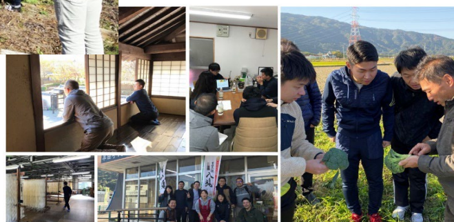
地域と企業の協働型ワーケーションの様子