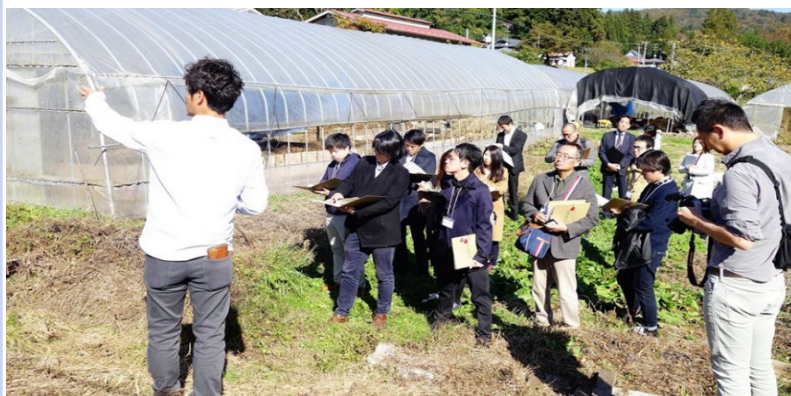
地域企業と複業人材の マッチングフィールドワークの様子

SDGsワーケーション(徳島・釜石)/HR/DXワーケーション(和歌山)/アートワーケーション(塩尻・三原・鳥取)/ラーニングツーリズム(南九州・徳島・琴平)/香川ワーケーション協議会 アドバイザー/宮城ワーケーション協議会 アドバイザー/ワーケーション自治体協議会 会員自治体向けセミナー講師/旅するようにワーケーション主宰など、自治体・地域団体と連携して、地域と企業の協働型ワーケーションを実施。