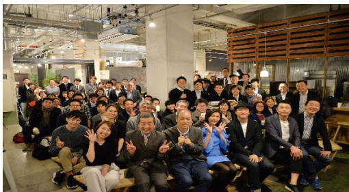
空き家や遊休不動産の利活用

現在の行政組織のままではなかなか組織横断的な取り組みにはしづらい、観光～交流人口～関係人口～移住定住促進までの一連の流れをユーザーエクスペリエンス(顧客体験)として設計し、施行することで実行力を持って取り組みを推進する。