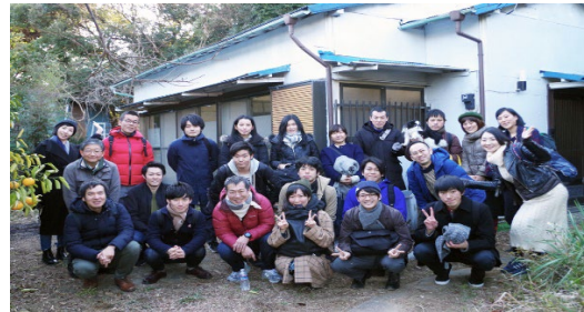
地域コミュニティ活性化