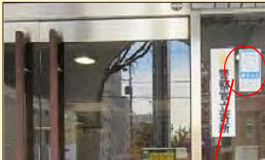
事務所玄関に「ほじょ犬マーク」を掲示