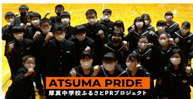
厚真中学生による地元事業者のPR活動「ATSUMA PRIDE PROJECT」(北海道)

地域の外からやってきた企業やコンサルがアイデアを持ってくる取り組みではなく、地域の人々に企画ノウハウを教えながら開発を進める「ひとつづくり型カリキュラム」を重視しています。これまで青森県事業、弘前商工会議所、仙台商工会議所、あきた企業活性化センター、復興庁事業などで商品開発アカデミーを実施。また三重県伊賀市、静岡県沼津市では事業者+市民有志の30~40人がチームに分かれて観光まちづくりや事業リブランディングに取り組んでいます。これまで180社以上の企画をサポート。対応できる分野は衣、食、住、美容、観光、サービス、教育など多岐にわたります。実際に売れるかどうか、人を魅了するかどうかについて豊富な経験をもとに都度的確なアドバイスを行うことが可能です。特に取り組みに参加した人(=事業者、市民有志、学生など)が「自分たちの力で生み出した」という実感を持ちながら企画を進めていけるところがポイントです。