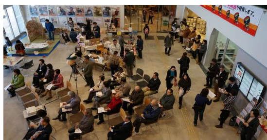
オガールプロジェクトのワークショップ 最終回はみんなで手作りフォーラムへ