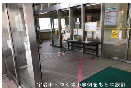
道本庁舎での消毒剤利用促進ナッジ(2020年) ※ 適正配置・矢印認知強化等で50%以上利用増加