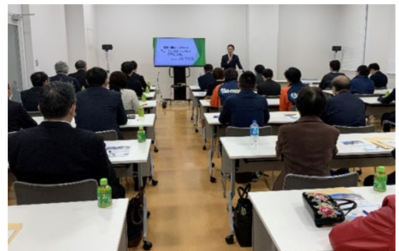
八戸市主催セミナー 『音楽×観光×スポーツ ミュージックツーリズムで八戸を元気に！』(2022年10月21日)