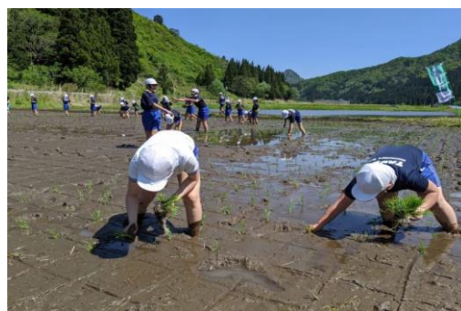
地域の持続可能を田植えから感じる小学校田植え体験