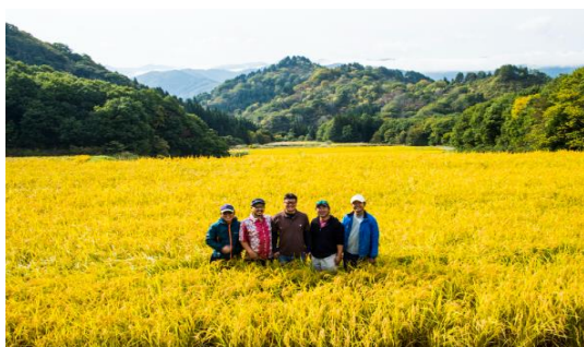
原料を生産する田んぼの保全

米焼酎については、只見線応援バージョンラベルや地域で邪魔物とされる雪を使用した雪むるバージョンラベル、近隣市町村との連携を図る取組から生まれた八十里越峠バージョンラベルなどの作成・販売、只見駅前広場での新たなドブロクの製造・販売、輸出専用日本酒の製造・販売など国内外を問わない幅広い地域と連携した取り組みを展開しており、只見町及び近隣地域の活性化及び交流・関係人口の増加に繋がっています。