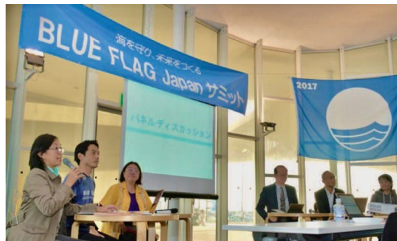
BLUE FLAG Japan サミット