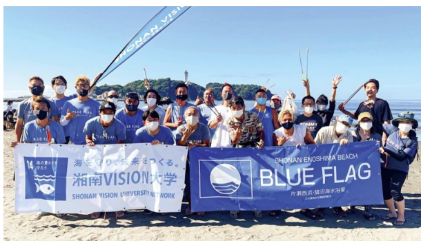
ブルーフラッグ取得に向けた海岸美化活動

2011年から海辺の国際環境認証「ブルーフラッグ」の取得支援の専門家として、全国各地の自治体等においてブルーフラッグ取得支援業務を実施してきました。2016年に神奈川県鎌倉市「由比ガ浜海水浴場」でアジア初のブルーフラッグを取得。2022年、ブルーフラッグ取得支援及び普及啓発を専門とする一般社団法人日本ブルーフラッグ協会を設立し代表理事に就任。ブルーフラッグに関する各種調査、取得支援、環境教育、イベント・シンポジウム、研修・人材育成業務を実施しています。日本全国の沿岸地域を対象に、ブルーフラッグを切り口とした「地域資源『海』を活かした地域ブランドの創出と持続可能なまちづくり」の支援業務を実施することで、持続可能なビーチ・マリナーを増やし、海辺からのSDGsの実現に貢献するとともに、持続可能な社会の発展に寄与していきます。