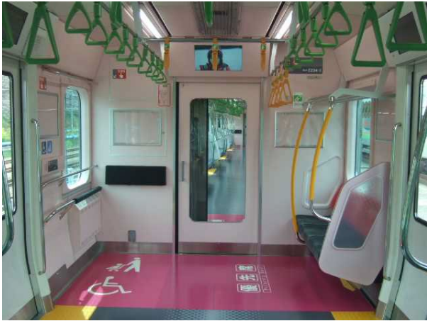
鉄道車両のフリースペース (東日本旅客鉄道)

これまでに、鉄道の場合、JR 6 社、大手民鉄16社、公営地下鉄 8 社全てにおいて導入済み。