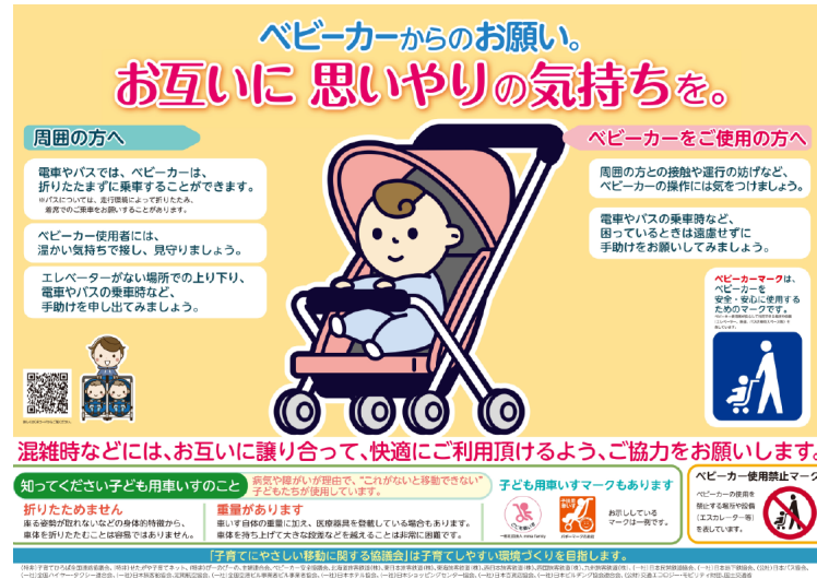
（キャンペーンポスター）

なお、このほか、毎年の障害者週間（12月3日～12月9日）の期間に、鉄道やバス車内の優先席や鉄道駅・商業施設におけるエレベーター等の利用に際し、障害のある方、妊産婦や乳幼児連れの方など、移動に配慮が必要な方に対して適切に配慮するよう、周囲の利用者の理解・協力を求めるキャンペーンも実施している。