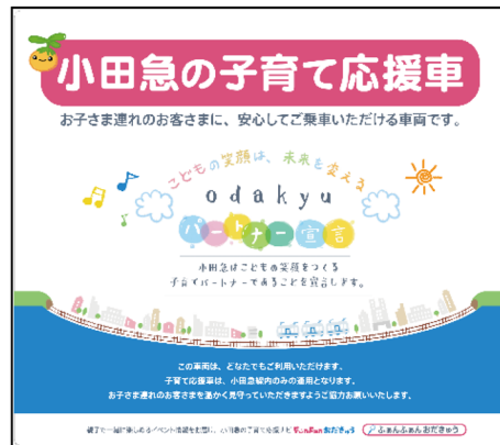
窓ガラス、貫通扉ステッカー