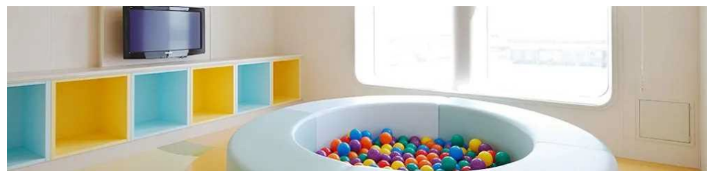
旅客船における子ども専用スペースの設置