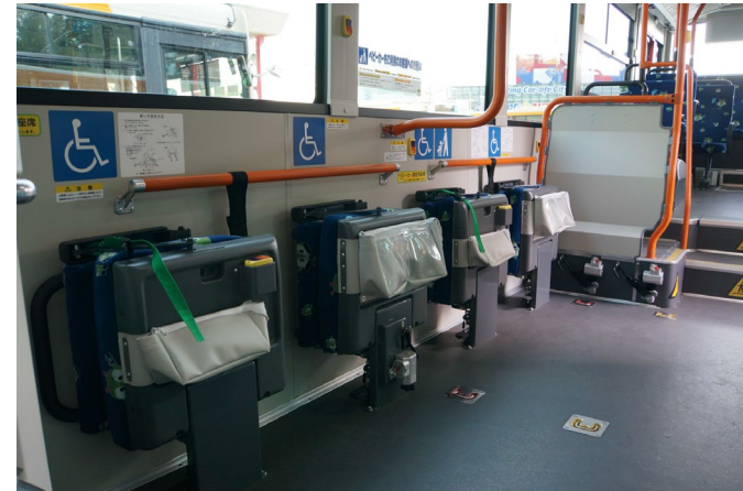
バス車両のフリースペース (東京都交通局)