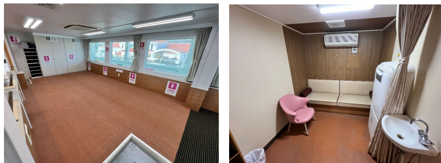
(女性専用スペース)