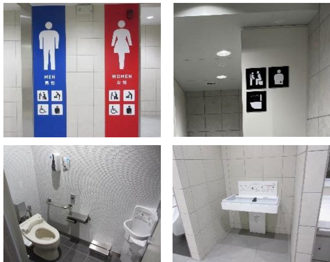
トイレへのベビーチェア等の設置(札幌市交通局)