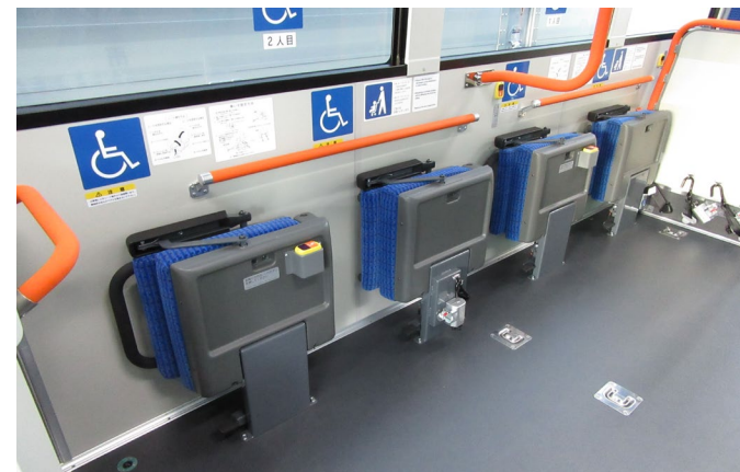
バス車両のフリースペース (名古屋市交通局)