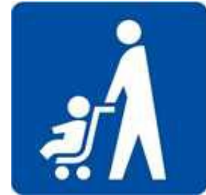
（ベビーカーマーク）