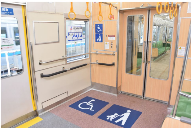
鉄道車両のフリースペース (福岡市交通局)