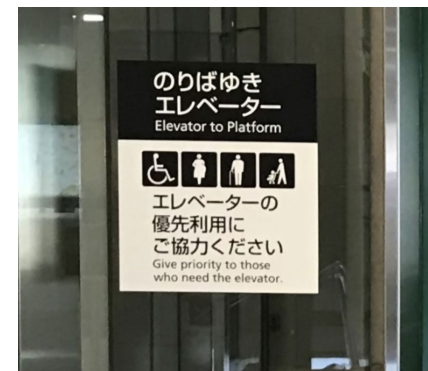
EVの優先利用案内整備(福岡市交通局)