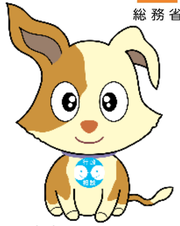
行政相談マスコット キクーン