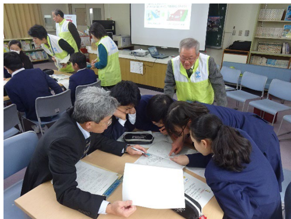
《令和元年度の行政相談出前教室（伊予市立由並小学校）開催風景》