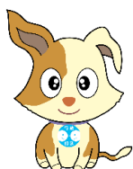
行政相談マスコット「キケン」

【特徴】実際に生徒から行政相談を受け付け、必要に応じて、行政機関等の協力を得ながら改善を促すなど、実践を伴った出前授業です。