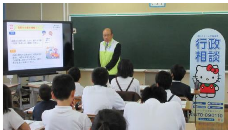
《平成 28 年度の行政相談出前教室（西条市立田野小学校・田滝小学校）合同開催風景》