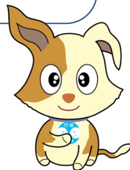
行政相談マスコット キクーン