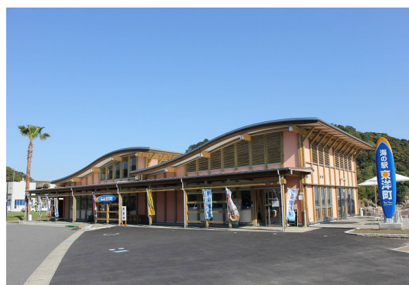
海の駅 東洋町(高知県東洋町)