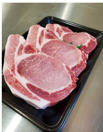
地元養豚場の豚のブランド化

また、自治体や1次産業に携わっている方々と一緒に地域食材の販路開拓や認知度向上、商品開発などをおこなっています。