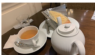
休暇に友人とケーキを食べて気分転換