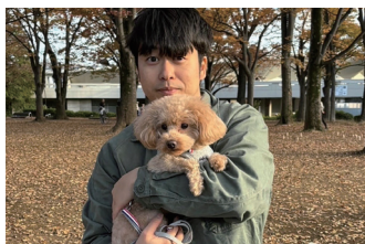
愛犬のモカちゃんとの2ショット