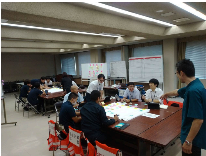
<フロントヤード改革個別伴走支援>