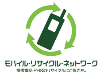
図表 5-6-1-2 MRN ロゴマーク

総務省では、引き続き関係省庁、地方公共団体、携帯電話事業者、端末製造メーカー等と連携しながら、周知・啓発活動等を実施し、使用済携帯電話の回収・リサイクル活動の促進に向けて取り組んでいくこととしている。