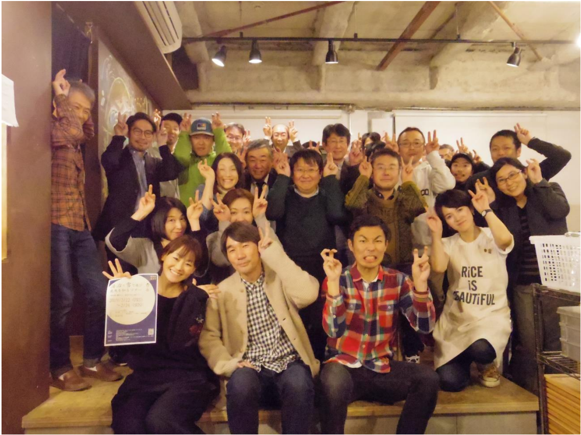
鹿角家家族の集合写真