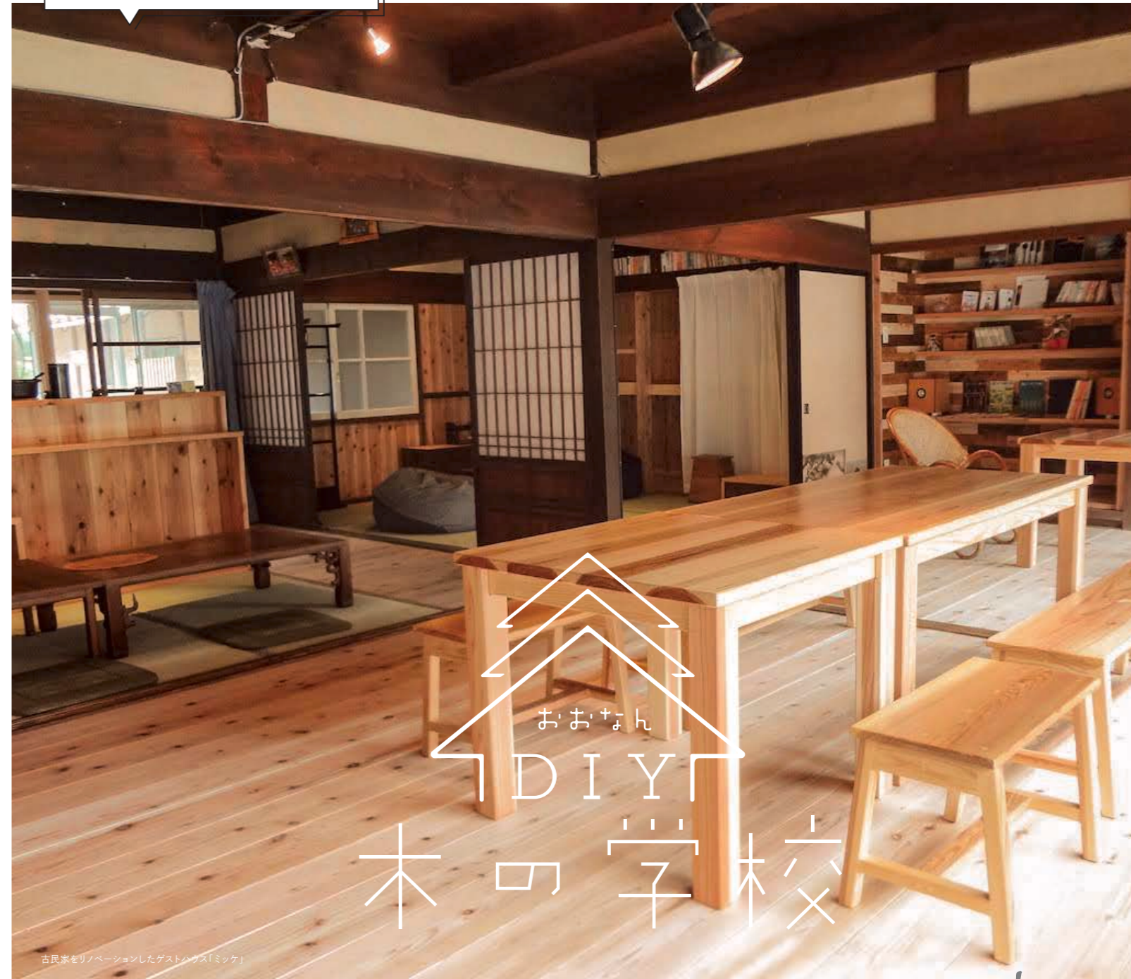
古民家をリノベーションしたゲストハウス「ミツケ」