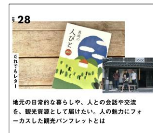
地元の日常的な暮らしや、人との会話や交流を、観光資源として届けたい。人の魅力にフォーカスした観光パンフレットとは

ライターとして、真庭市の魅力を掘り起こし、市内、県内、県外問わず「こんなに素敵な魅力があるんだ」という情報を発信しています。真庭市交流定住センターが運営するオウンドメディアで記事を執筆したり、都心部が読者層である地域特化型メディアに記事を掲載するなど、様々な媒体を通じて真庭市の魅力を届ける（触れてもらう）よう活動しています。