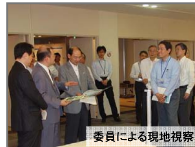
委員による現地視察