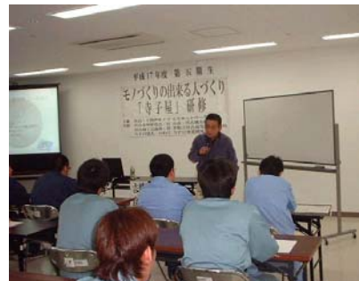
モノづくりのできる人づくり「寺子屋」