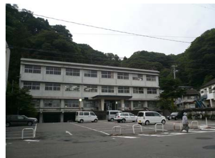
宮古市産業支援センター

宮古市では、2005年に合併する前から、「産業振興」、「子育て支援」、「地域自治」の3つの行政課題があった。「産業振興」としては、当初、工業分野を中心に企業と県、大学との連携事業を行っていたが、合併後の新・宮古市では工業分野だけでなく、より広い分野の産業振興に力を入れていくことになった。そして、2007年4月に、地場産業振興の中核として、宮古市産業振興部に「産業支援センター」を立ち上げることになり、その所長に、市担当者が就任した。