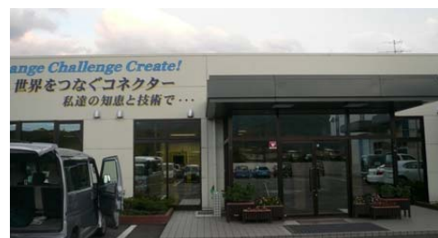
コネクター製造会社

宮古市で工業振興政策に取り組み始めた頃、担当者は一人で活動していたが、2年目には、岩手県や大学、商工会議所とのつながりを作っていた。まず、財団法人いわて産業振興センター（県の外郭団体）との協力・連携を深めていき、1999年からは、