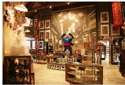
昭和ロマン蔵（左：外観、右：「駄菓子屋の夢博物館」）