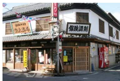
「昭和の町」の修景を終えた店舗