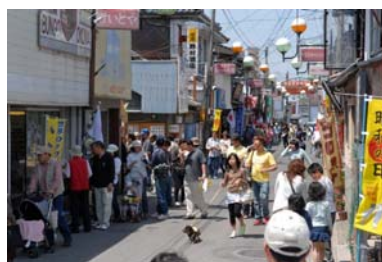
多くの観光客でにぎわう 「昭和の町」(新町通り)