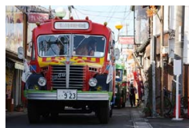
「昭和の町」の商店街（左：昭和30年代の車、中央：買い物をする観光客、右：ボンネットバス）