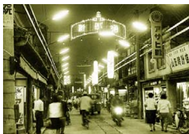
昭和30年代の中心市街地 (新町通り)

しかし、受入体制はまだ十分ではなかったことから、窓口となった商工会議所は過剰な業務を抱えることになり、これを見かねた豊後高田市は、2007年に第3セクター方式で「豊後高田市観光まちづくり株式会社」（以下、まちづくり会社）を設立した。これを契機に、豊後高田市の「昭和の町」はまちづくりの第2ステージへと進み、まちづくり会社によるマネジメントで「昭和の町」の振興とともに、国東半島全体や農業連携に視点を向けるなど、新たな展開を見せている。