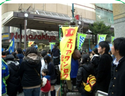
参加者への案内ブース クラブスタッフで運用