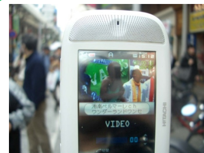
ライブ中継で、離れた場所 でもステージが見れる