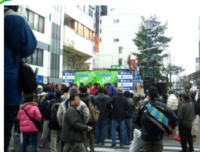
イベントステージ 人が殺到して近くでは見れない