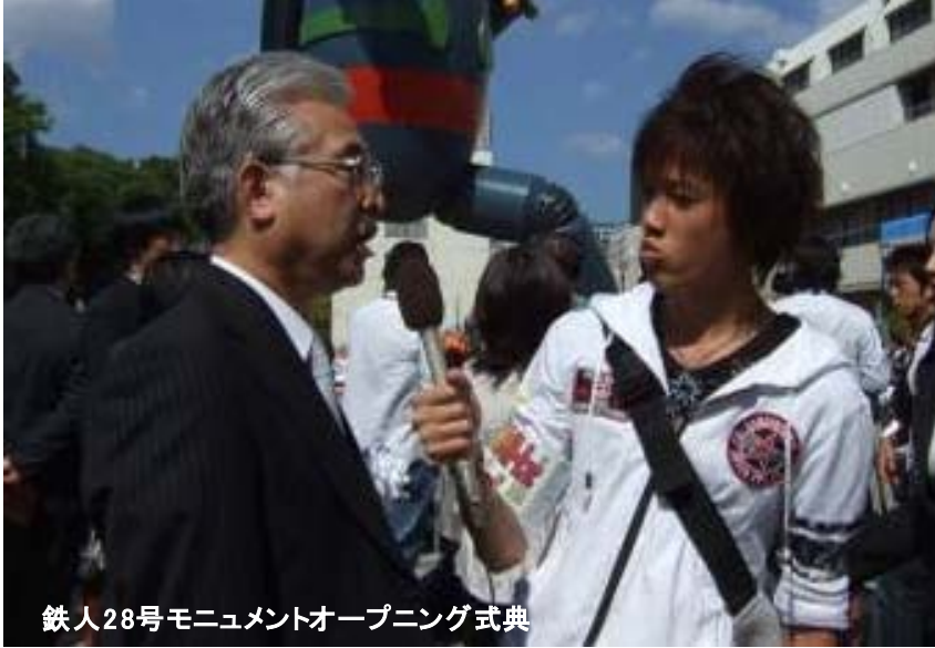
鉄人28号モニュメントオープニング式典