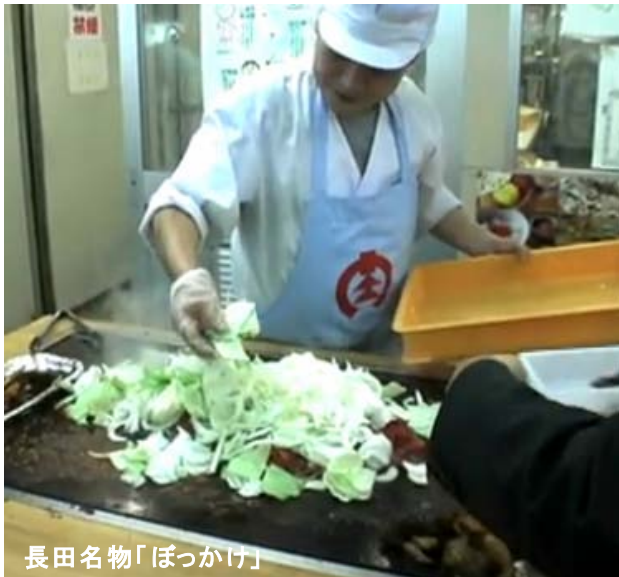
長田名物「ぼっかけ」