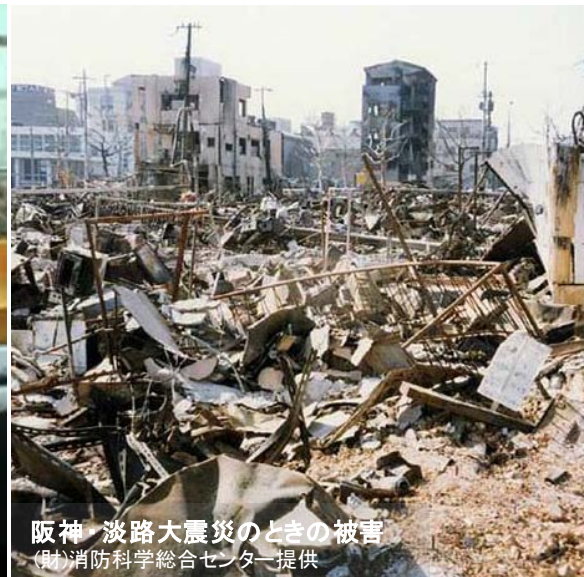
阪神・淡路大震災のときの被害