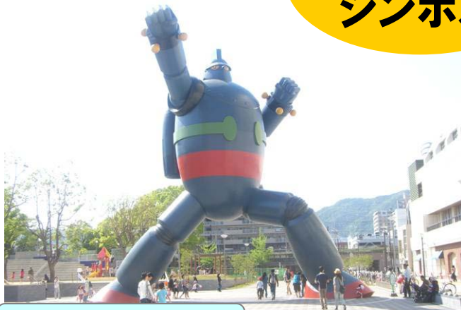
鉄人プロジェクト