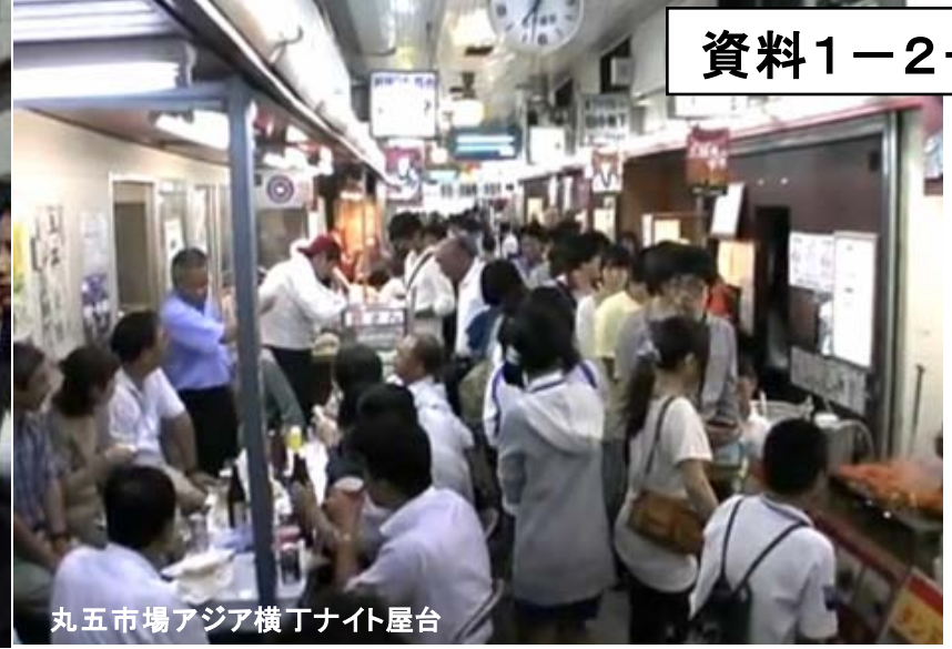
丸五市場アジア横丁ナイト屋台