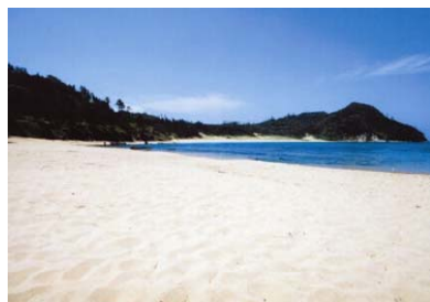
最大級の鳴き砂の浜 「琴引浜」