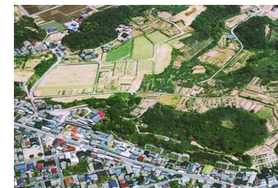
日本海側最大の前方後円墳 「銚子山古墳」