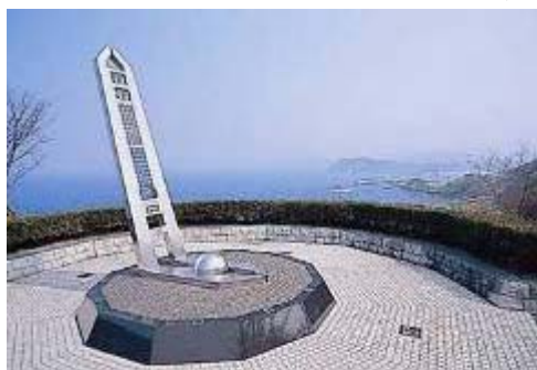
日本最北の子午線塔

沿岸部は山陰海岸国立公園、丹後天橋立大江山 国定公園に指定され、内陸部には標高400～600mの山々が連なります。