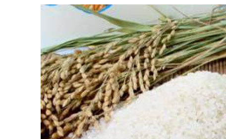
特Aランクの「丹後コシヒカリ」 幻の「間人(たいざ)ガニ」