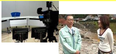
ケーブルテレビ局 コミュニティ番組