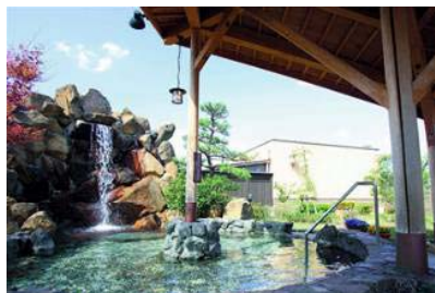
源泉数京都府一の温泉