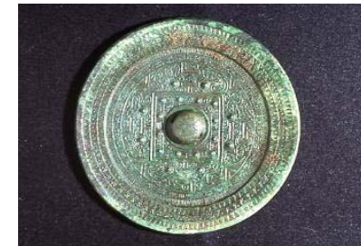
日本最古の紀年銘鏡 「方格規矩四神鏡」