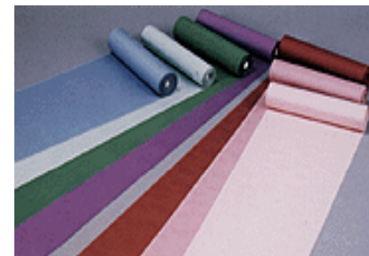
伝統の「丹後ちりめん」