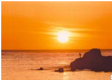
日本の夕日百選 「夕日ヶ浦」