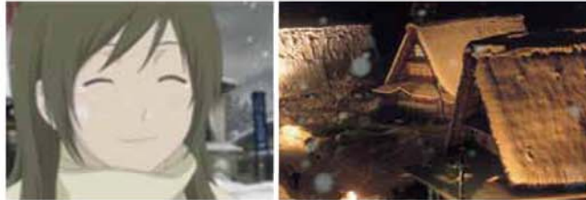
〔泣かせる味に会いたい〕 五箇山のおじいちゃん編